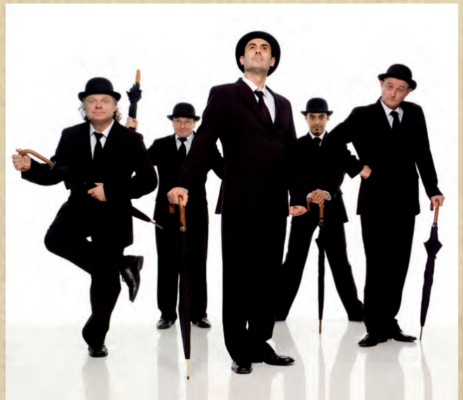
Los mejores sketches de Monty Python, más de tres años en cartel

En el año 2002, L'OM-IMPRESBÍS comienza una labor de acercamiento e investigación del teatro en África que cristaliza, en 2008, con la creación de CITA (Centro Internacional para el Teatro Actual) y la puesta en marcha del proyecto Orígenes , que dio como resultado un primer espectáculo con ese nombre, que reunía a 24 artistas de las cinco etnias de Guinea Ecuatorial y que pudo verse en 2011 en las Naves del Matadero de Madrid.