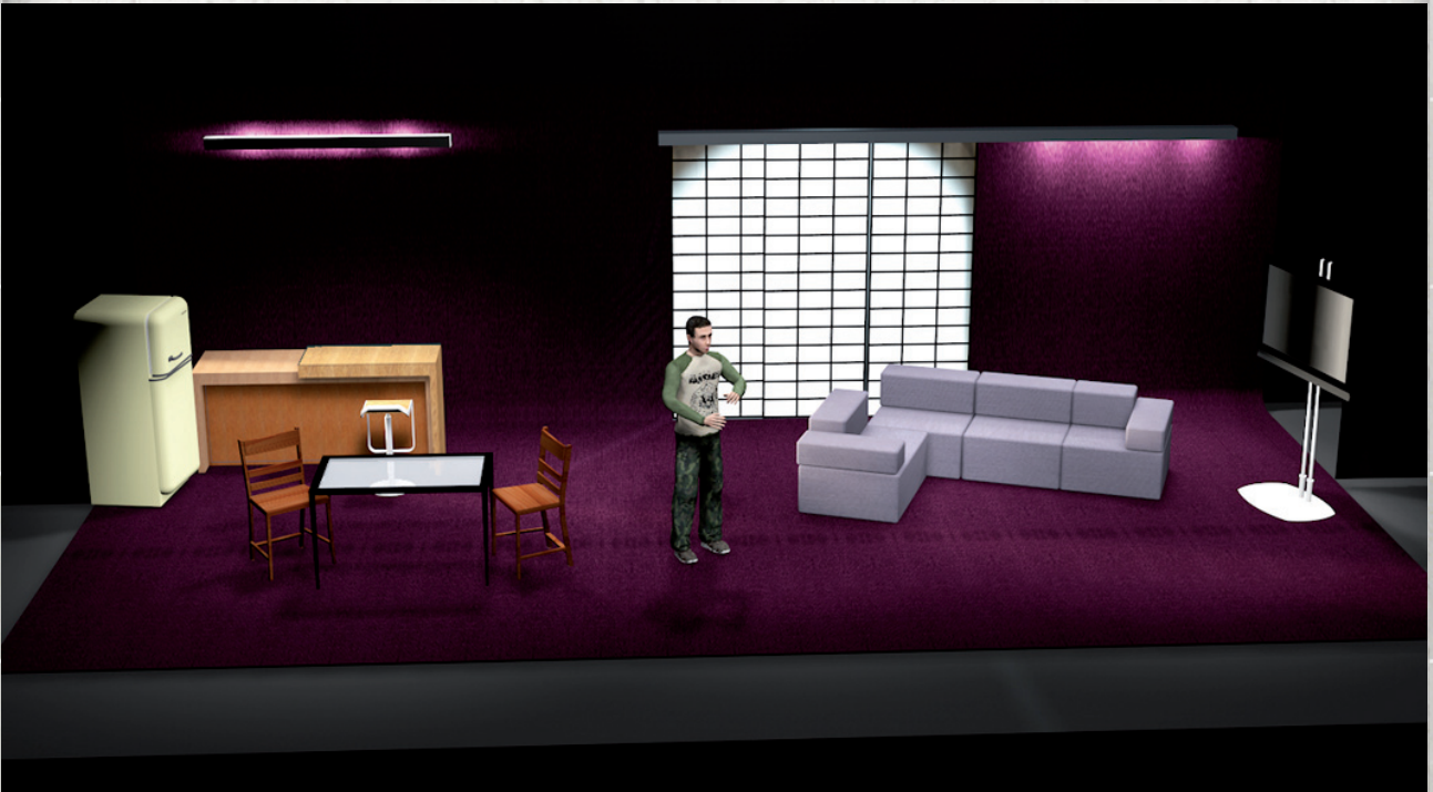
Infografía 3D de la escenografía diseñada por Eduardo Moreno

Los integrantes de una comisión judicial se disponen a ejecutar el primer desahucio del día: una mujer que debe varios meses de hipoteca, cuyo apartamento ha pasado a ser propiedad del banco. Un caso más en su rutina cotidiana, si no fuera porque esta vez son recibidos por un hombre que, después de hacerles pasar amablemente, les apunta con una escopeta, y dispara a uno de ellos. A partir de ese instante, el individuo procede a explicar sus razones, mientras todos se preguntan cuál puede ser el próximo.