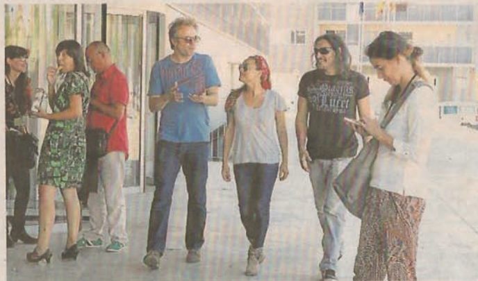
Tristán Ulloa y los dos protagonistas de la obra pasearon por la ciudad.