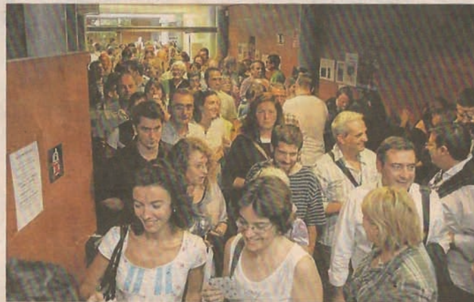
El público llenó la sala del Matadero. En la imagen, los pasillos momentos antes de la entrada. X SOBANTES

Otros sin embargo, acudieron porque gustan de ver cada año alguno de los espectáculos y este era el que más les encantaba por hora, otros porque viajaban desde pueblos del Pirineo y solo tienen un día para disfrutar del teatro, eso sí, en jornada maratónica. Todos, los fans y los que no lo son tanto, se encontraron con un Ulloa que hasta momentos antes de la función paseaba por el patio de butacas, desde el cuarto de sonido hasta el escenario, sin perder detalle de nada e incluso saludando a quien se acercaba. También se toparon con una obra que encendió al público que aplaudió y aplaudió hasta casi emocionarse a los actores que saludaron, acompañados de su director, al respetable que llenó la sala.