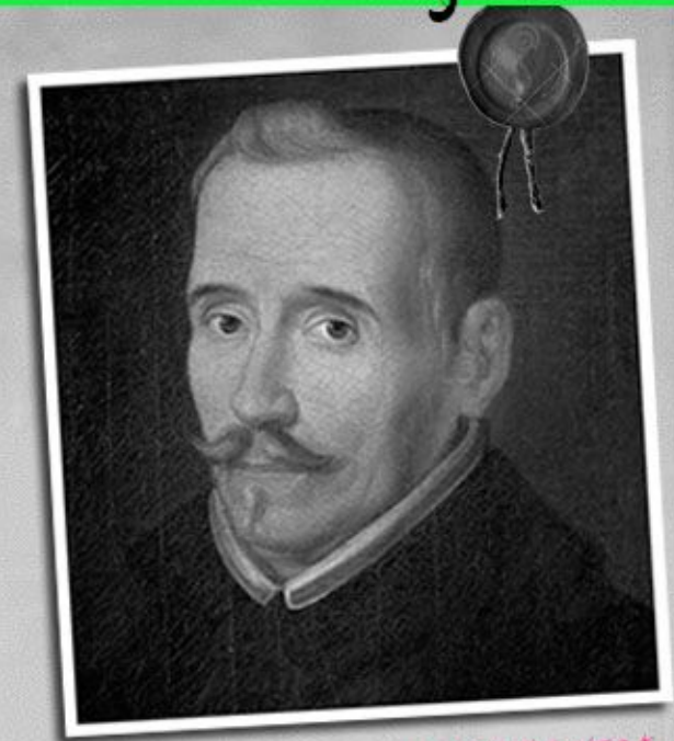
LOPE DE VEGA

“Las dos bandoleras” fue escrita en el año 1630.